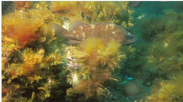
Foto: Ejemplar de MERO, entre algas, pólipos y restingas

Los fondos de la península nos sorprenderán sobremanera por su colorido y extrañas formas. Las especies costeras de peces no son muy numerosas, pero son de una mansedumbre tal, que hasta se les puede dar de comer en la boca.