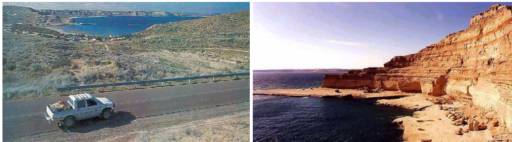
Vista de la entrada a Puerto Pirámides y sus Acantilados

Pirámides es indiscutiblemente un lugar donde el visitante se encuentra con la naturaleza en un estado muy puro y se llevará en sus retinas las imágenes imborrables. Sus playas de suave declive están protegidas por los acantilados que se asemejan a pirámides , a las cuales le debe su nombre, y en los que se encuentran restos de invertebrados fosilizados de hasta 9 millones de años de antigüedad.