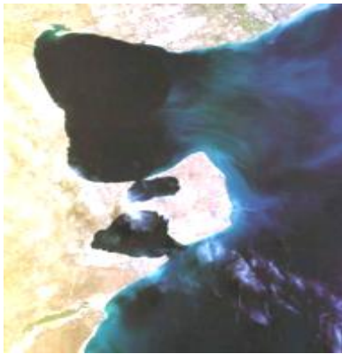
Imagen satelital de Península Valdés, Provincia de Chubut, Patagonia Argentina.