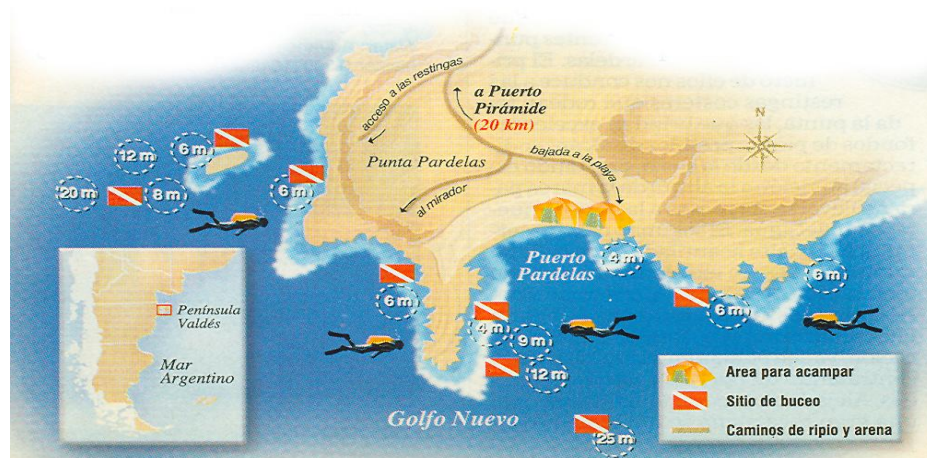
Foto: mapa de P.PAREDELAS con sus puntos de buceo

PUNTA PARDELAS: Si bien Pirámides es la base para todos los servicios, los puntos de buceos ubicados en las restingas de Punta Pardelas no tienen ningún desperdicio. Ubicada a unos 20km por caminos de ripio o 2,5 millas náuticas si vamos en embarcación, es otra alternativa muy fuerte para los buzos. Todas sus restingas son excelentes, con abundante fauna entre sus rocas e innumerables cuevas.