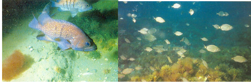
Foto: Meros, sargos y cabrillas

Debajo de las rocas podemos localizar grandes colonias de pólipos que a la luz de los flashes nos asombran con sus colores. También habitan pequeños escrófalos, los mansos pecho chancho, las cabrillas, los meros, pequeños pulpos (muy ricos), medusas de diversos tipos y tamaños, también estrellas y plumas de mar, cangrejos araña y pequeños y amenazantes bogavantes. También podemos cruzarnos con cardúmenes de meros, cabrillas o "turquitos", y sargos.