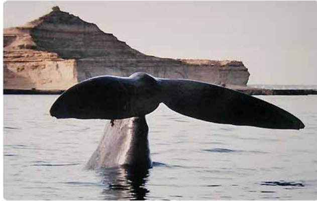
Majestuosa cola de ballena Franca Austral Pirámides, Provincia de Chubut, Patagonia Argentina.